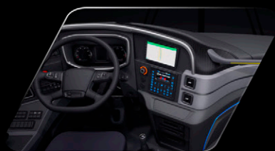
Cabine, uma experiência envolvente