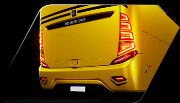
Conjunto óptico de iluminação modular