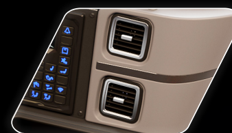
Conjunto de 6 saídas de ar-condicionado direcionado ao motorista.