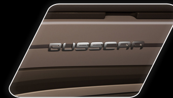
Letreiro cromado e acabamento da cabine em texturas únicas em vinil.

Inovação em design e ergonomia compõem a cabine do motorista do Panorâmico DD NB1, com destaque para a iluminação indireta no ambiente.